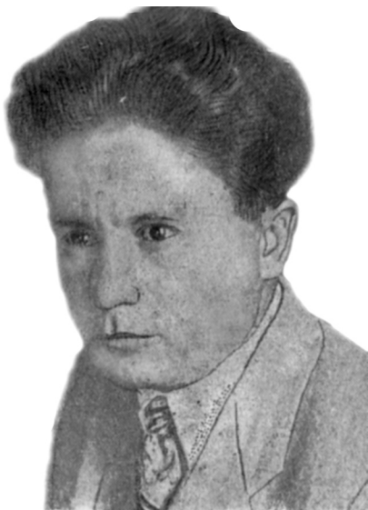
С. Носиров (1901-1938)